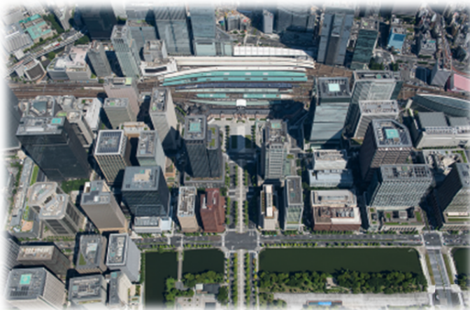
大手町・丸の内・有楽町エリアとつながる 光ファイバネットワーク